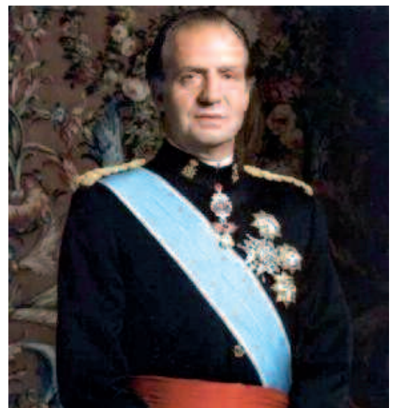
Joan Carles I