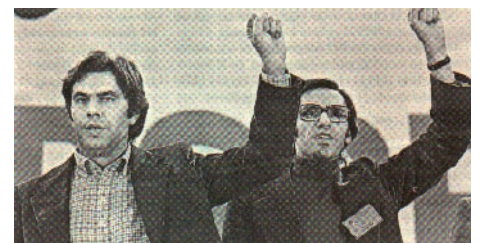
Felipe González i Alfonso Guerra

SOCIALISME. El socialisme proposa un sistema econòmic i polític basat en l'administració i gestió dels mitjans de producció per part de l'estat, per a evitar que una minoria de la població, aquells que posseeixen els mitjans de producció, explotin a la majoria que no els té i es veu obligada a treba-