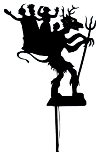
Figura per a teatre d'ombres occidental

que es representa en ombres. Això produeix un efecte d'identificació amb l'espectador, que veu les aventures del protagonista com a seves. El que li passa al protagonista, per molt trapella que sigui, Karagoz en aquest cas, és més proper, més «real» que el que passava als déus de les ombres orientals.