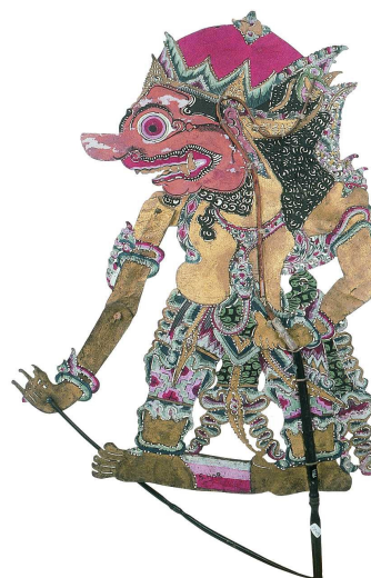
Figura per a teatre d'ombres javanès

A partir de la fascinació primitiva de les ombres, de la necessitat d'encarnar en figures plàstiques els codis socials i de conducta de la comunitat, les cultures orientals van desenvolupar representacions d'índole religiosa d'una gran complexitat literària i musical que van arribar a ser enormement populars i que en alguns països s'han conservat fins als nostres dies. La temàtica emprada és fonamentalment de caire mitològic. A l'Índia, i també a Indonèsia, es representen ja des del segle IV aC. diferents versions de les antigues epopeies del Mahabaratha i del Ramayana. A la Xina, els temes mitològics es representen mitjançant diferents llegendes locals, la més popular de les quals és La serp blanca.