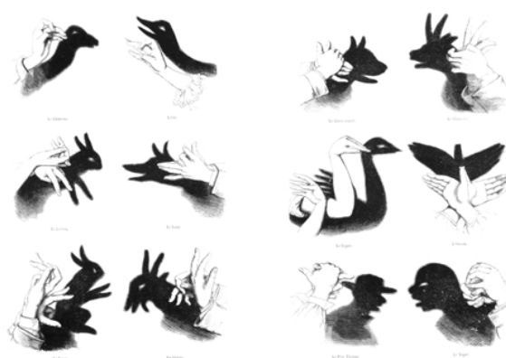
Exemples per a fer figures amb l'ombra de les mans

Aquest ressorgiment va ser aprofitat també per Rudolph Salis, que realitzava espectacles d'ombres a la sala Le Chat Noir dirigits a un públic format per artistes i intel·lectuals de l'època.