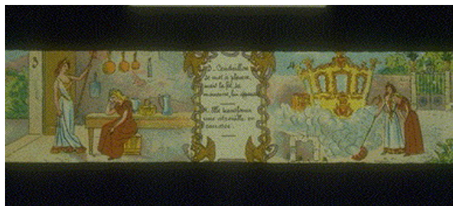
Placa de llanterna màgica. La Ventafocs

Un altre espectacle audiovisual anterior al cinema amb una profunda voluntat narrativa va ser la llanterna màgica. Aquest invent consistia en una caixa a l'interior de la qual hi havia un focus lluminós i unes lents que permetien projectar, en una superfície plana situada en una sala a les fosques, imatges fixades sobre una placa de vidre. La llanterna màgica va tenir una gran difusió i es va convertir en un espectacle ambulant. Al llarg del segle XVIII marxants de llanterna màgica recorregueren viles i ciutats d'arreu d'Europa, carregats amb la seva llanterna, plaques de vidre i sovint amb un instrument musical (orgue de Barbarie) que ambientava les projeccions i il·lustrava les explicacions del projeccionista.