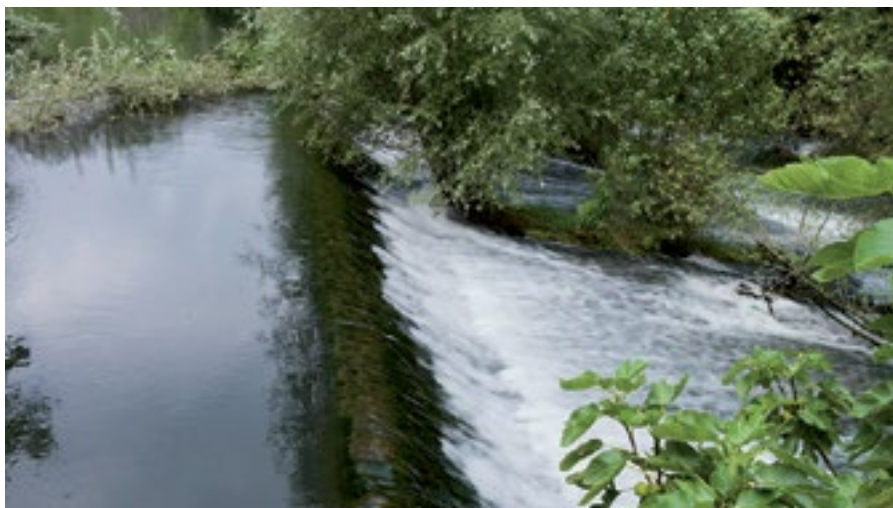
Resclosa de Montfullà.

Com a mínim des del segle XIV, la séquia Monar arrenca d'una presa situada a Montfullà (dins del municipi de Besanó). L'actual es coneix com la presa de la Pilastra. Fins ben entrada l'època moderna s'anomenava la resclosa Reial i, si bé la localització concreta no devia canviar gaire, va ser transformada i millorada al llarg dels segles.