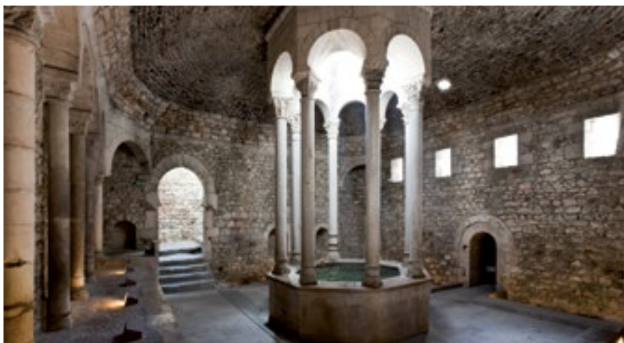
Banyes Àrabs. Fotografia del Consell Comarcal del Gironès (2016)

L'aigua sempre s'ha associat simbòlicament a la idea del naixement i a la puresa. El sagrament del baptisme, que consisteix en la immersió, aspersió o afusió d'una persona en aigua beneïda, és símbol de neteja del pecat original. A la comunitat jueva, la realització de la immersió ritual al micvè assegura la purificació prescrita per la Torà en moments determinats del cicle vital, sobretot entre les dones.