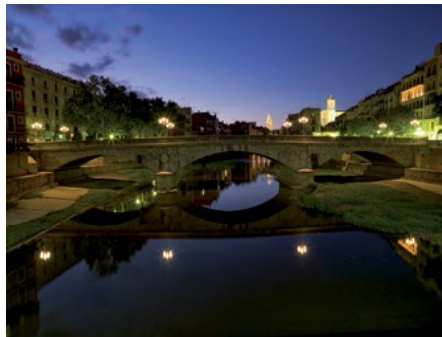
Pont de pedra. (2016)