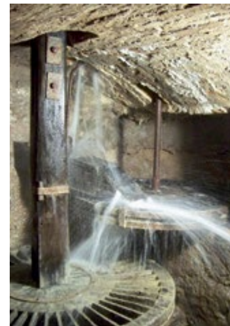
Molí hidràulic (anònim)

A banda d'aprofitar-se per regar hortes, el corrent de la séquia, gairebé des de la seva creació, ha activat rodes de molins. Així, sobretot en el tram final proper al desguàs a l'Onyar, on la conducció se separava en tres o quatre braços, s'hi han instal·lat tradicionalment els principals complexos de molins de la ciutat. Es tracta del que es coneixia des del segle XIII com el Monar Reial, format per molins fariners i, en menor nombre, drapers. A més de canviar l'emplaçament concret de cada instal·lació en diferents ocasions, a partir del segle XVI s'amplià el ventall de molins amb la instal·lació d'uns quants dedicats a esmolar, a preparar claus, a processar pólvora i a elaborar paper. Si bé de forma més discontinua, també hi hagué alguns molins d'aquests tipus a prop del nucli de Salt i del de Santa Eugènia.