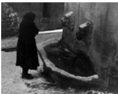
Dona omplint una galleda d'aigua.

El domini dels usos austers i limitats de l'aigua dins les llars fins a mitjan segle XX va donar peu a una sèrie de famílies d'atuells de terrissa destinats a complir diferents funcions relacionades amb l'aigua a la llar.