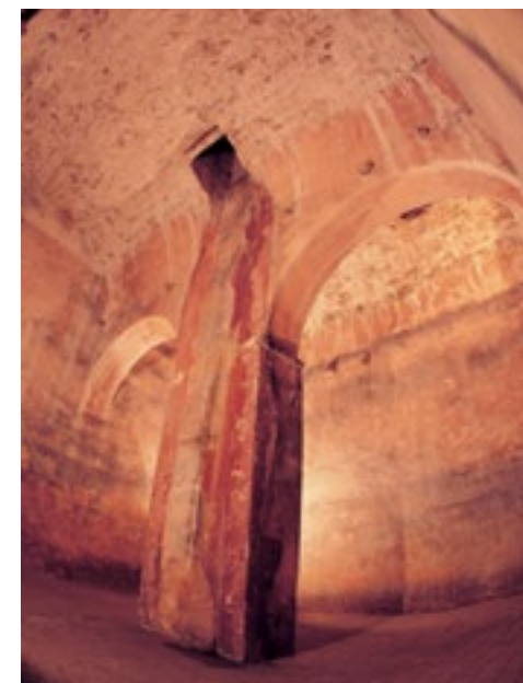
Cisterna del convent de Sant Antoni de frares caputxins, actual MHG. Fotografia de Jordi S. Carrera (2003)

Les fonts urbanes més antigues que es coneixen són la de la plaça dels Lledoners (mitjan segle XV) i la font de la Mare de Déu de la Pera (1525). L'aigua era conduïda des de la mina del Calvari fins a la font dels Lledoners i la cisterna de la Catedral, que alimentava la font de la Mare de Déu de la Pera. Al sector de l'Areny també se'n documenta més d'una, com la del carrer Argenteria i la del carrer Nou del Teatre, ambdues anteriors a 1500. A l'altra riba de l'Onyar, a banda de les que quedaven fora muralles, hi havia la font d'en Vila, situada a la banda occidental de l'actual plaça Catalunya (amb precedents anteriors al segle XIII), i la font major del Mercadal, a tocar del tram final de la séquia Monar (com a mínim, del segle XVI).