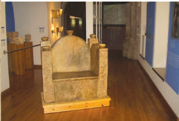
Càdira episcopal, dita de Carlemany, Segle XII. Còpia en guix de l'original conservada a la Catedral de Girona. Sitial episcopal atribuido a Carlomagno. Siglo XII. Còpia de yeso del original que se conserva en la Catedral de Girona.

Durant l'època medieval s'organitza el govern de la ciutat, que sota el control de l'Administració reial, impartia justícia, garantia l'ordre públic, administrava les finances, controlava els mercats i la qualitat dels productes i s'ocupava del sanejament i de l'assistència social. També és destacable el paper que va jugar la comunitat jueva al segle XII i, sobretot, al segle XIII.