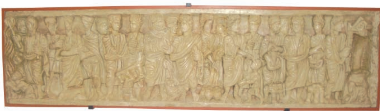
Frontal de sarcòfag. 315- 335 dC. Correspon a un dels sis sepulcres cristians de taller romà conservats a Girona. Còpia en guix de l'original del presbiteri de l'església de Sant Feliu. Frontal de sarcòfag. 315- 335 dC. Corresponde a uno de los seis sepulcros cristianos de taller romano que se conservan en Girona. Còpia en yeso del original del presbiterio de la iglesia de Sant Feliu.

Després de patir el domini musulmà, Girona es va lliurar a Carlemany i esdevingué la capital del comtat. El feudalisme va suposar l'inici d'una època important de creixement que, durant els segles XIV i XV, convertí la ciutat en la segona de Catalunya, amb una població de 10.000 habitants. El vell recinte emmurallat romà va quedar petit i la ciutat es va estendre cap als dos costats de l'Onyar, amb un fort creixement urbanístic i demogràfic.