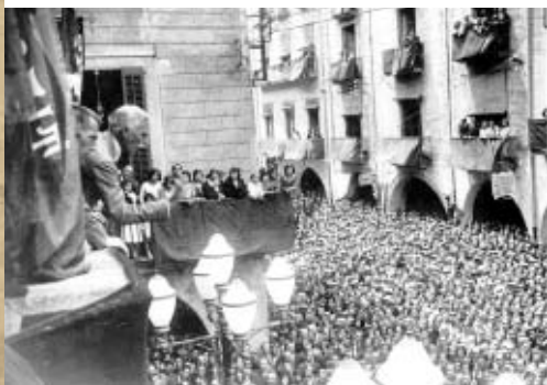
Francesc Macià al balcó de l'Ajuntament de Girona, el 19 de desembre de 1931.

Girona va viure de prop els fets polítics de Catalunya i l'Estat. L'apogeu del catalanisme, els conflictes socials i, sobretot, l'arribada de la II República van ser els fets que es van viure de manera més intensa.