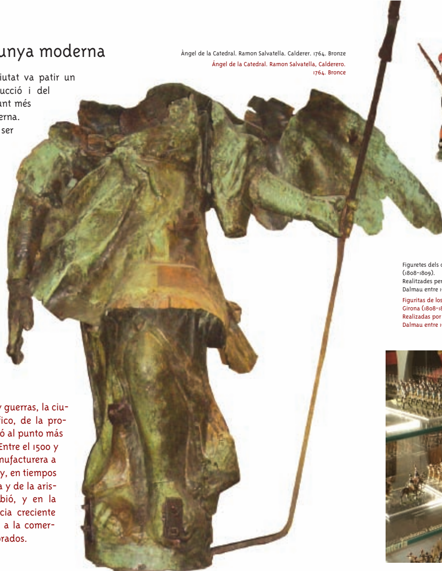
Àngel de la Catedral. Ramon Salvatella, Calderer. 1764. Bronze Àngel de la Catedral. Ramon Salvatella, Calderero. 1764. Bronce

Después de un período de asedios y guerras, la ciudad sufrió un descenso demográfico, de la producción y del comercio, que la llevó al punto más bajo de toda su historia moderna. Entre el 1500 y el 1800 pasó de ser una ciudad manufacturera a convertirse en una plaza de armas, y, en tiempos de paz, en un baluarte de la Iglesia y de la aristocracia local. Su economía cambió, y en la misma adquirieron una importancia creciente los oficios mercantiles, vinculados a la comercialización de productos semielaborados.