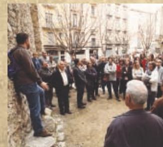
Itineraris per la ciutat / Itinerarios por la ciudad