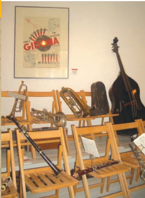
Instruments d'una cobla / Instrumentos de una cobla