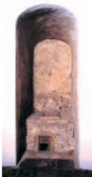
Detall nínxol del cementiri. (1753) Detalle nicho del cementerio. (1753)