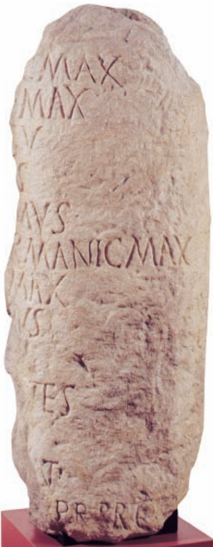
Mil·liari. 238 dC. Correspon a l'emperador C1 Verus Maximinus . Procedent de Sarrià de Ter (Gironès). Còpia en guix de l'original. Milliario. 238 dC. Corresponde al emperador C1 Verus Maximinus . Procedente de Sarrià de Ter (Gironès). Còpia en yeso del original.

El progreso de Gerunda iba ligado a su condición de mansio o etapa en el itinerario que seguía la Via Augusta, el eje principal de comunicaciones entre Hispania y el resto del Imperio. Una densa red de vías y caminos, conectaba la ciudad con las villas y otras poblaciones de la costa y del interior.