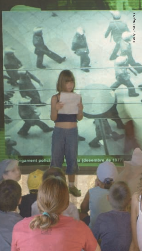
Disseny: Jordi Fanyaràs

17004 GIRONA TEL 972 22 22 29 FAX 972 20 69 89 museuciutat@ajgirona.org www.ajuntament.gi/museuciutat