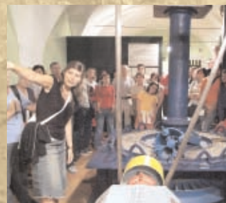
Visites guiades / Visitas guiadas