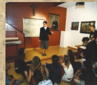
Visites teatralitzades / Visitas teatralizadas