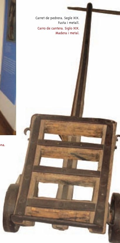
Carret de pedrera. Segle XIX. Fusta i metall. Carro de cantera. Siglo XIX. Madera i metal.