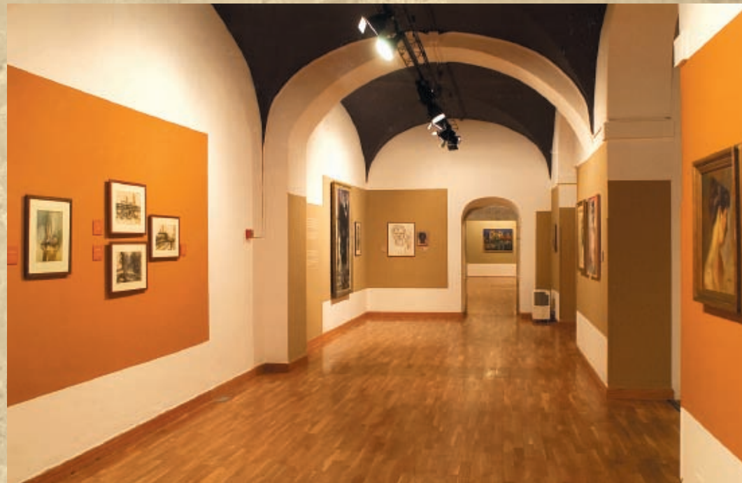
Exposicions temporals / Exposiciones temporales