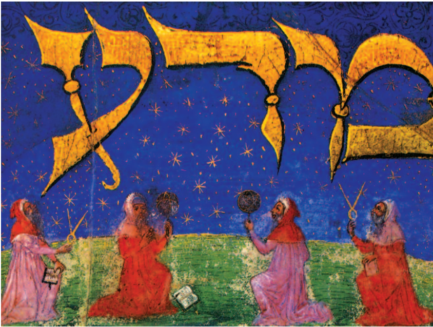
■ Astròlegs i astrònoms jueus. Còdex Rossian 498, fol. 13v. Itàlia, 1450. Biblioteca Apostòlica del Vaticà.

L'art de les ciències d'astronomia i d'astrologia va ser altament desenvolupat entre els jueus catalans. Solien treballar al servei de reis i prínceps, que els tenien en gran estima; així ho manifestava Pere el Cerimoniós, quan declarava que per als encàrrecs de taules i càlculs astronòmics “hem cercat els homes més suficients i aptes que hem pogut trobar”; la majoria d'aquests homes eren jueus, afamats “mestres de brúixoles” i experts en la construcció d'instruments com rellotges i astrolabis, que eren els instruments de càlcul més importants de l'època. A la vitrina se'n mostra un amb ins-