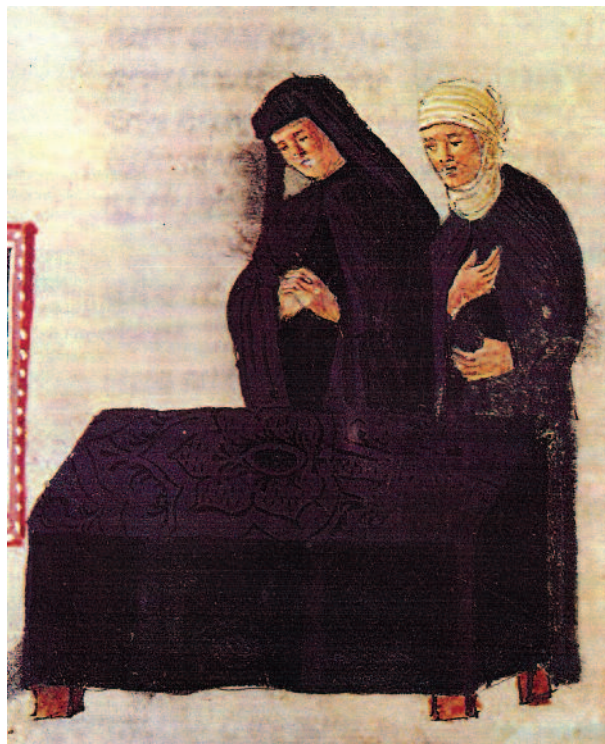
2 Escena de dol i vetlla Hagadà Italiana (s. XV); British Library, Londres

tida en una de les inscripcions: Sempre he portat una existència tranquil·la i són moltes les coses que he aconseguit. Per això, ara que ja he arribat als meus darrers dies i ja he estat cridat per a retornar als orígens, la meua llum segueix envoltant-me.