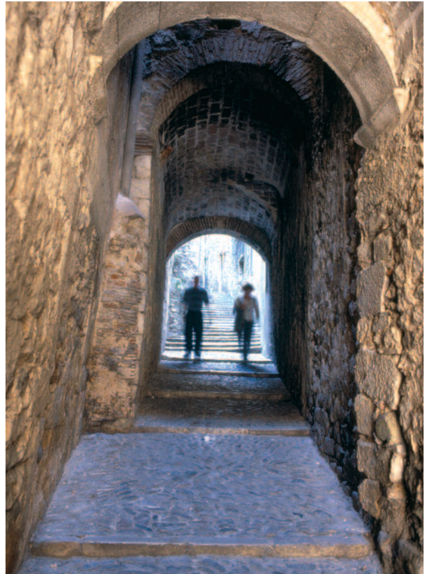
1 Fotografia del carrer de Sant Llorenç (Patronat Call de Girona).

El fet que els jueus s’apleguessin al call responia sobretot a la tendència pròpia d’una societat que, minoritària com era, necessitava l’entorn comunitari i un espai concret i delimitat on poder desenvolupar la seva vida religiosa i els seus costums i tradicions. A aquest fet cal afegir-hi les ordres de segregació i de prohibició que la societat cristiana dictava contra les comunitats jueves. El 1215 el IV Concili Laterà va decretar la separació de les comunitats de jueus o de musulmans que vivien a les ciutats cristianes. Però a Catalunya, en la majoria de casos, les ordres de segregació no es van complir fins molts anys després. Al segle XIV, el call de Girona era escenari de coexistència: en els seus carrers hi havia cases i tallers de jueus i de cristians. D’altra banda, no tots els jueus de la ciutat vivien dins del call. Però l’any 1445, el govern municipal va prohibir als jueus d’establir-se a la banda oest del call, més enllà de l’actual carrer de la Força, i va obligar-los a clausurar les portes i finestres que