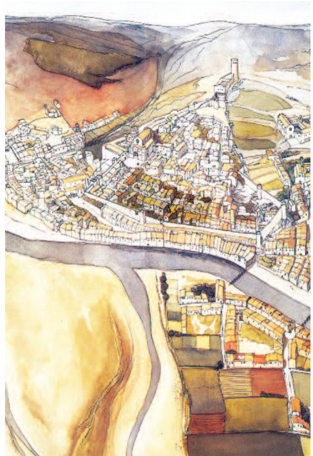
3 Dibuix de Girona al s. XIV amb el call. Canal, J. i altres a "La ciutat de Girona en la 1a meitat del s. XIV" (1998)

Els calls, que als segles XIII i XIV havien sigut escenari d'una coexistència majoritàriament pacífica entre dues societats ben diferenciades, varen esdevenir al segle XV, a causa sobretot de la radicalització de les mentalitats cristianes, indrets marginals, llocs de reclusió, barris residuals d'una forma de vida que s'acostava a la seva fi.